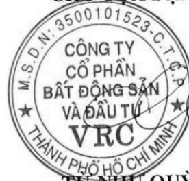
TỪ NHƯ QUỲNH